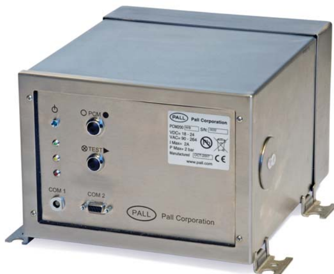
Прибор контроля чистоты серии Pall PCM200