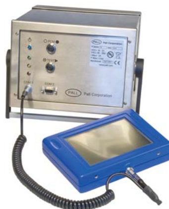
Дополнительный портативный дисплей

Программа автономного дисплея обеспечивает отображение данных в реальном времени и сохранение результатов тестов для последующего анализа и построения графической зависимости. Измеренные данные также могут быть переданы на ПК или PLC с использованием стандартных кодов ASCII II.